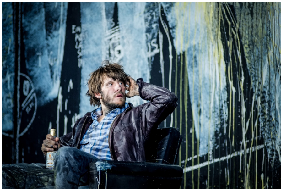
2014年9月24日至28日，来自柏林邵宾纳剧院的《人民公敌》在伦敦巴比肯艺术中心戏剧厅演出

演员们的服装粗犷不修边幅，气质特别像居住在柏林的青年艺术家，在简单甚至有些简陋的环境中，充满了对于世界的抗争。这个空间时而是医生斯托克芒的家，时而是报刊编辑室，之后又